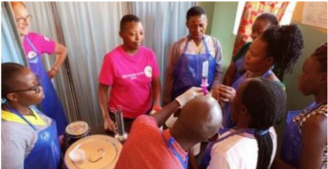
Træning af sygeplejesker i offentlige sundhedscentre i at udføre screening for livmoderhalskræft